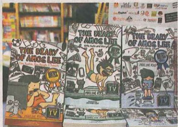
■《The Diary of Amos Lee》系列受各地小朋友歡迎，現已進軍香港。